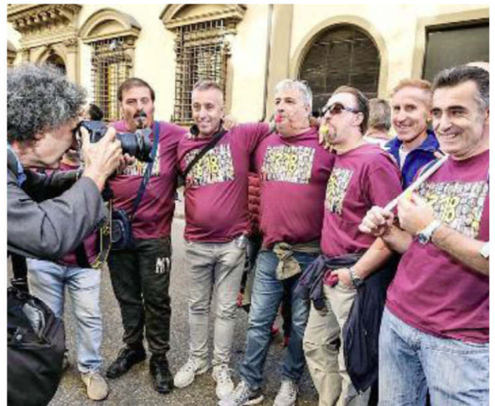
Manifestazione dei lavoratori Bekaert davanti alla Prefettura

Dopo 28 giorni di sciopero i 39 facchini del magazzino di Reggello continueranno a lavorare ma su altre sedi